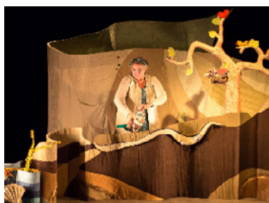
'Petite Chimère' par la Cie Les Voyageurs Immobiles

Du spectacle vivant et de la médiation culturelle pour toutes les écoles maternelles : 1088 petits spectateurs et leurs accompagnateurs