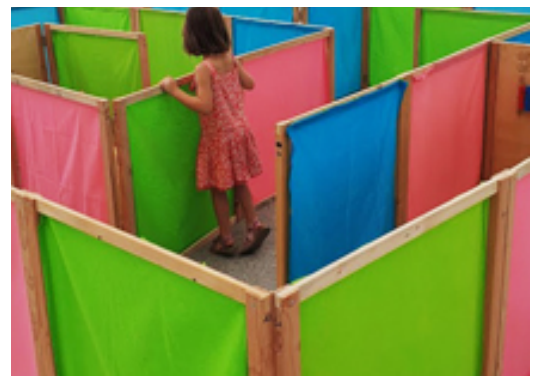
Le Labyrinthe des petits par Magik Bazar www.magikbazar.fr