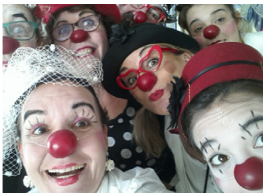
Déambulation clownesque par Les Nez-en-Plus www.lesnezenplus.wordpress.com