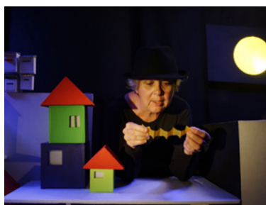
'Hop là !' par la Cie 1,2,3 Soleil