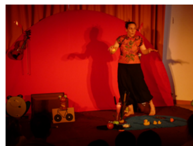
'Les Crapauds' par Stéphanie Joire

Des lectures musicales pour les crèches et à la ludothèque pour les assistantes maternelles