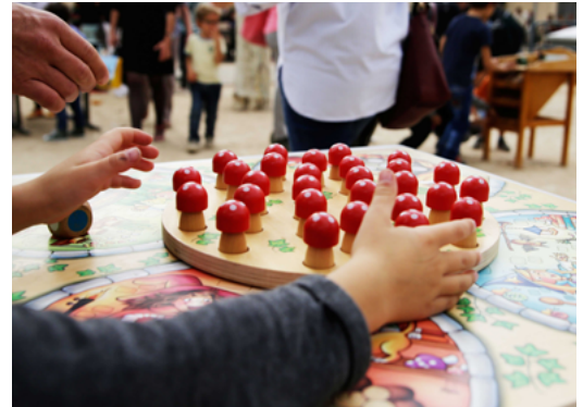
Coin des Jeux par Mistigri www.mistigri.net