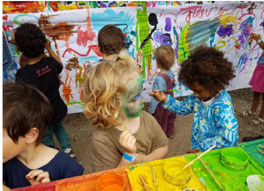
Fresque Murale par Doodle & Co

Activités et Ateliers gratuits tout au long de la journée