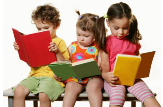
Coin Lecture par Lire et Faire Lire www.lireetfairelire.org